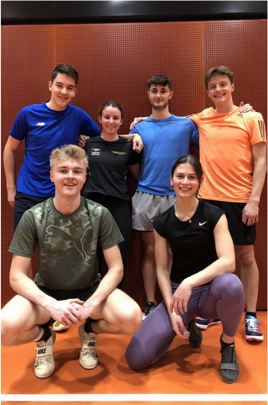
Weit- und Dreisprunggruppe Donnerstag