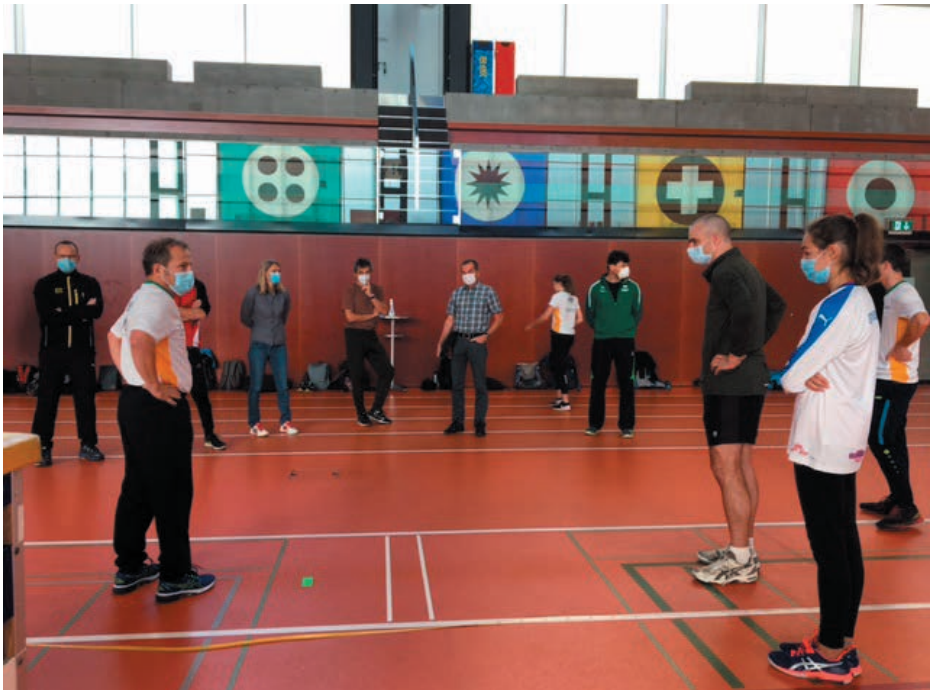
Trainerworkshop im Oktober 2020