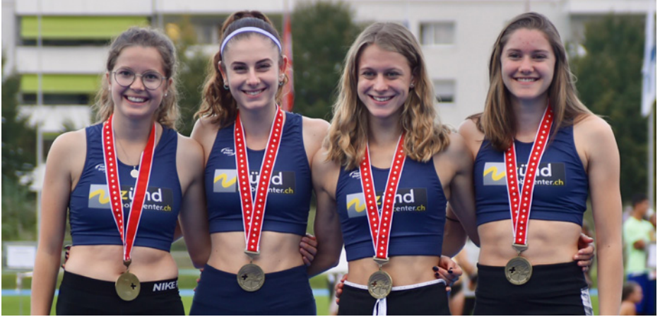
Staffelteam 4x100m, U20, Athleticteam KTV Altstätten