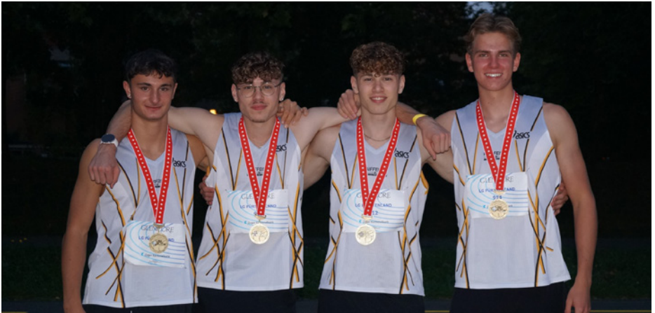
Staffelteam Olympisch mit OA-Rekord, U20, LG Fürstenland