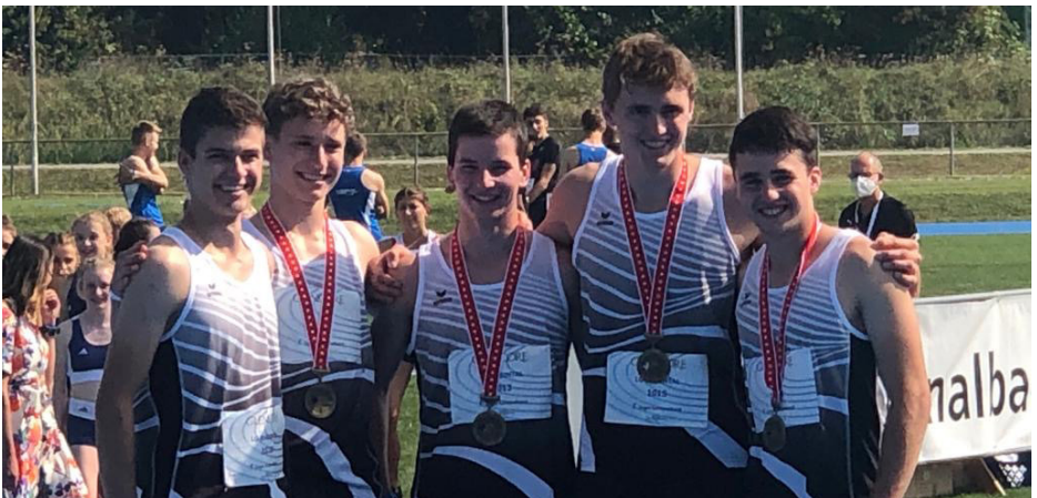
Staffelteam 4x100, U18, LG Rheintal